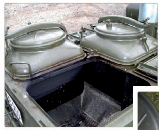
Schnelle Reinigung der Edelstahlkessel